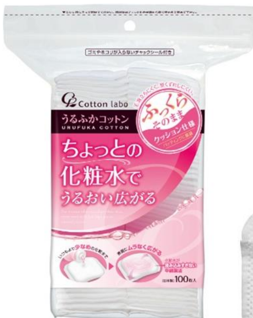
うるふかコットン 100枚入 オープン価格

肌あたりがとても“なめらか”で“ふっくら”、かつヨレや型くずれしにくいいため、パッティングに最適な化粧用コットンです。