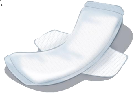
ふつうの日用 羽つき 約 21 cm

お肌に直接あたる表面シートは、無農薬有機栽培の オーガニックコットンのみを使用しています。