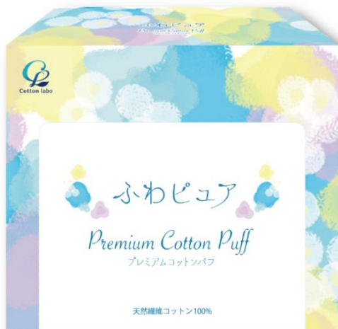
左：『ふわピュア プレミアムコットンパフ』 (オープン価格)

特に化粧綿を使用していただきたい若い世代の感性を取り入れたパッケージは、シンプルでドレッサーに合うおしゃれなデザインでありながら、開口部がわかりやすい機能性にも優れたデザインとなっています。