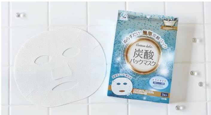
『コットン・ラボ 炭酸パックマスク 3枚入』（化粧品） 希望小売価格 620円（税別）