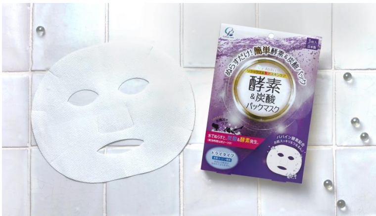
『e - BUBCO 酵素パックマスク 3枚入』（化粧品）