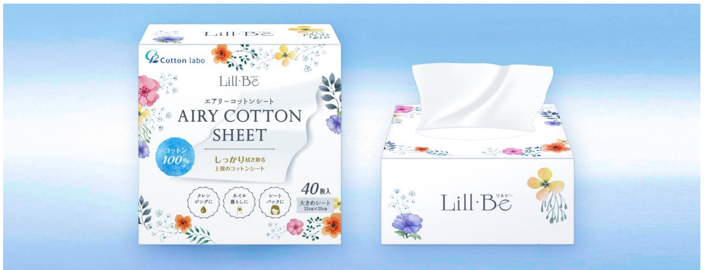
『Lill Be エアリーコットンシート 40枚』