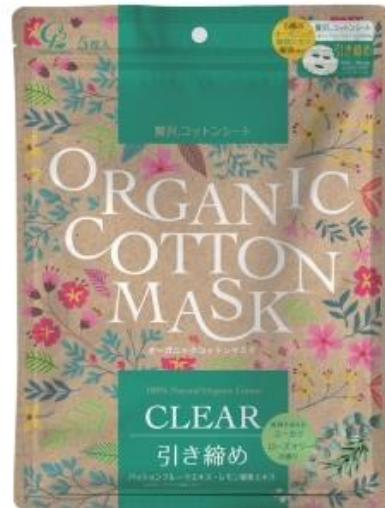
『オーガニックコットンマスク clear 5枚』