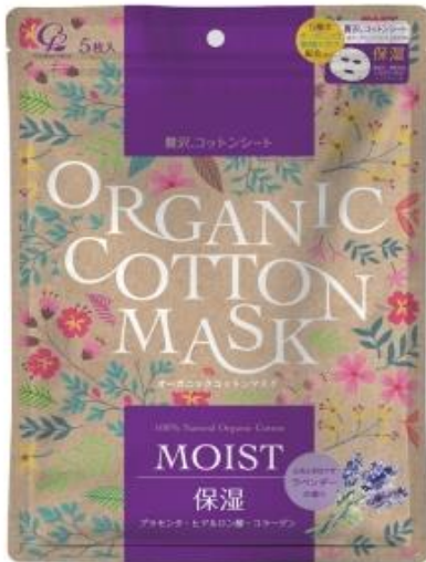
『オーガニックコットンマスク moist 5枚』

コットン・ラボ株式会社（本社：東京都豊島区、代表取締役社長：岡山 順吉）は、オーガニック植物エキス配合の美容液を、オーガニックコットン 100%のシートに含浸した『オーガニックコットンマスク moist 5枚』『オーガニックコットンマスク clear 5枚』の2種類を2019年2月21日より発売いたします。