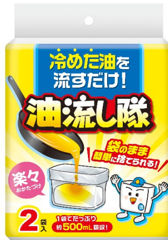
『油流し隊』 参考価格 168円（税別）