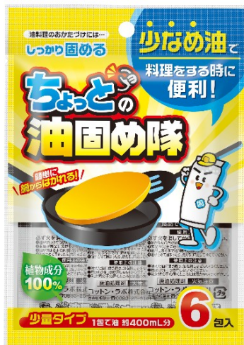
『ちよっとの油固め隊』 参考価格 128円（税別）

コットン・ラボ株式会社（本社：東京都豊島区 代表取締役社長：岡山 順吉）は、油料理後の片付け用商品として『油処理商品シリーズ』2品（ちょっとした油固め隊・油流し隊）を2020年9月1日より発売いたします。