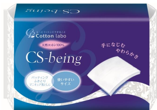
CS ビーイング 100 枚入