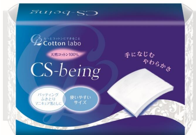
CS ビーイング 200 枚入