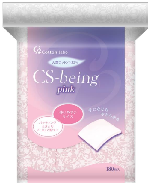
CS ビーイング Pink

また、保管の際にはホコリなどが入りやすく衛生的に保管ができるチャック付き袋を採用いたしました。