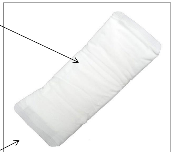
ふつうの日用 羽なし 約21cm

『オーガニックコットンナプキン』は使用感にこだわった結果、従来重要とされてきた「スリムであること」「経血を長時間吸収すること」とは相反し、これらの機能をあえて無視することで、ふんわりやわらかな質感を実現しております。